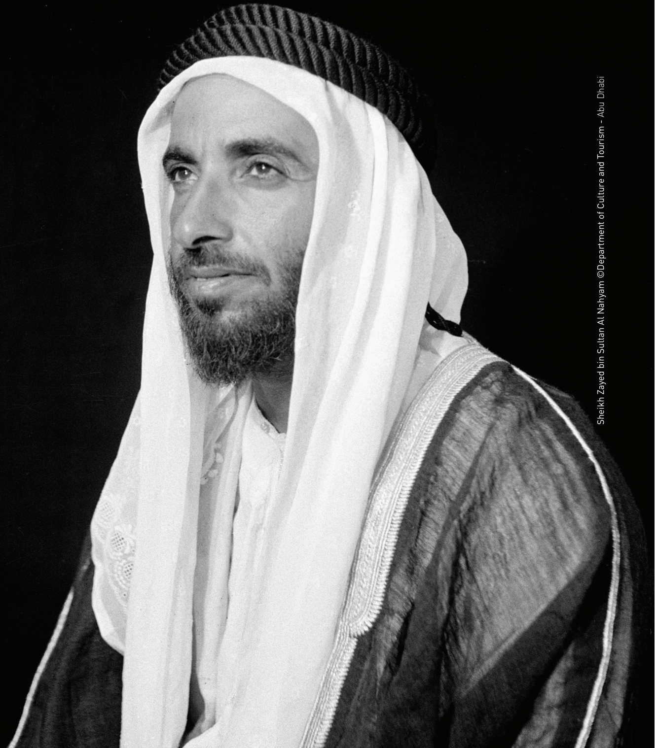
Sheikh Zayed bin Sultan Al Nahyan

The late Sheikh Zayed bin Sultan Al Nahyan